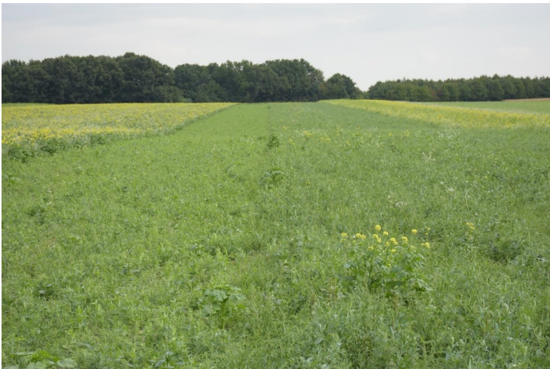
Abb.2: Entwicklung der Leguminosen-Mischung Mitte links: Anbaudatum zweite August-Dekade Mitte rechts: Anbaudatum erste August-Dekade Links und rechts außen: Anbaudatum Ende Juli