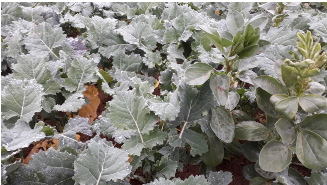
Abb.6: Links: Variante Raps ohne Begleitsaat Rechts: Variante Raps mit Ackerbohnen-Begleitsaat Aufnahme vom 29.10.2018

Bei einer anderen Variante wurden vor dem Grubbern 70 kg Ackerbohnen ausgestreut und eingegrubbert. Unmittelbar danach erfolgte die Rapssaat.