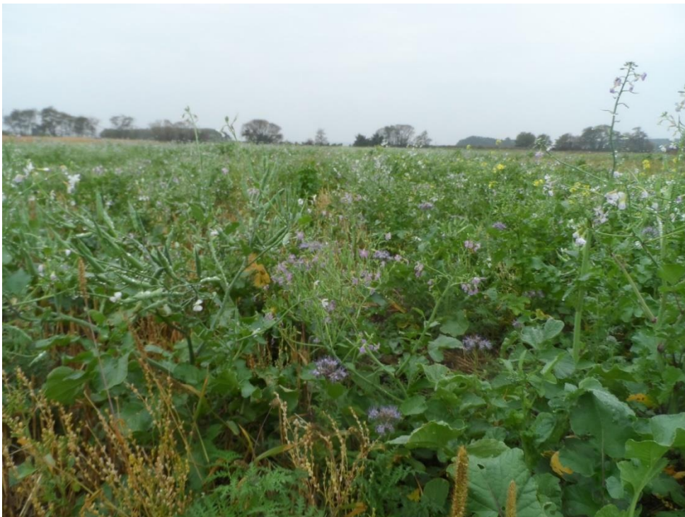
Abb.3: Entwicklung der Referenz-Zwischenfruchtmischung in Neckenmarkt – z.T. ein dichter Bestand;