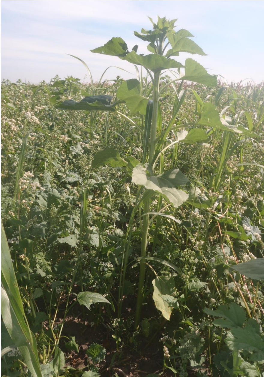
Abb.1: Zwischenfruchtmischung Anbauzeitpunkt Ende Juli