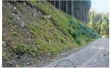
Böschung mit offenen Bodenstellen