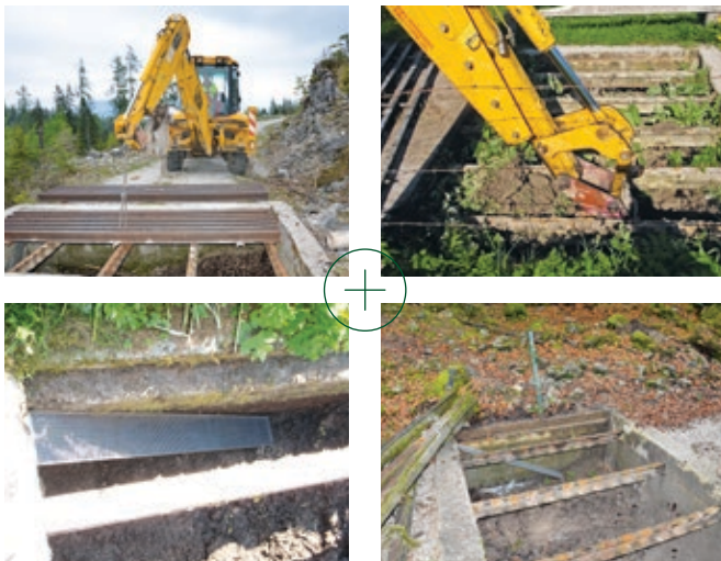
Entschärfung des Falleneffektes des Weiderosts durch Einbau einer Aufstiegshilfe für Amphibien .