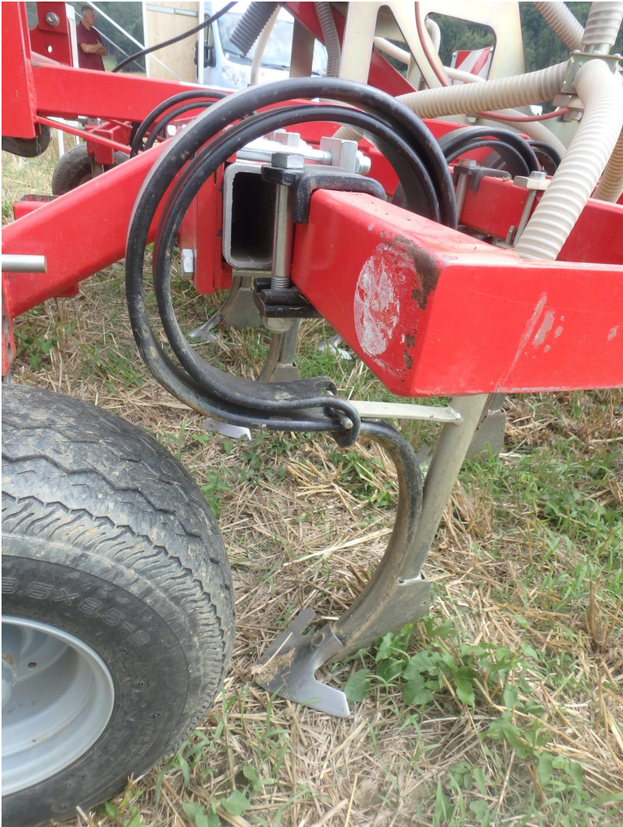
Doppelfeder-Zinken mit Gänsefußschar (und Saatstiefel für die Zinkensaat)

Eine Besonderheit dieses Gerätes ist der Doppelfeder-Zinken. Dieser soll verhindern, dass die Zinken in festen Bodenbereichen (z.B. in der Fahrspur) zu weit nach hinten ausweichen und dort nicht mehr ganzflächig arbeiten.