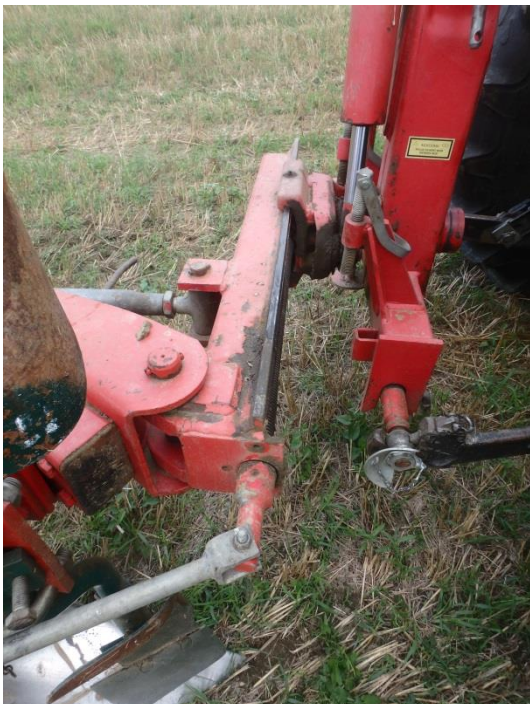
Umgedrehter Grenz-Pflug-Anbaubock zum On-Land-Pflügen

Beim vorgestellten 3-Schar-Grenzpflug wurde die On-Land-Tauglichkeit dadurch erreicht, dass der Anbaubock umgedreht wurde – der Pflug wird nicht nach außen Richtung ungepflügt für das Pflügen entlang der Grundstücksgrenze geschoben, sondern nach innen Richtung gepflügt – unter Verzicht auf die Grenz-Pflug-Eignung.