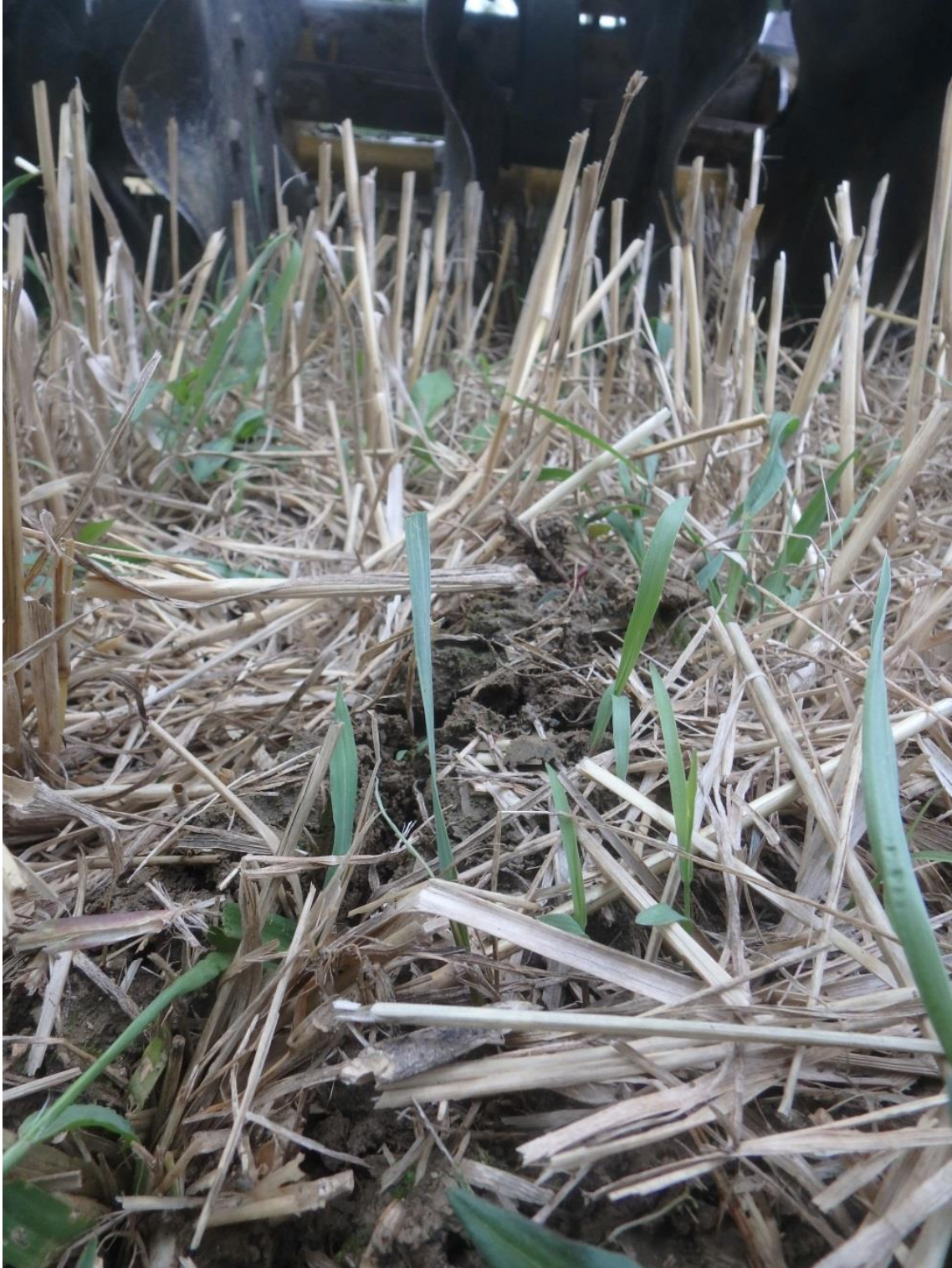
Front-Messerwalze mit Scheibenegge: Rillen der Scheibenegge – „Vorschneiden“ des Bodens

Wenn keine langstängelige Biomasse vorhanden ist, die das Frontgerät zerkleinern kann, rollt es mit relativ wenig Wirkung über den Boden. Bei genauerer Betrachtung können v.a. die Rillen der Scheibenegge gefunden werden. Ein derartiges Einschneiden der Oberfläche kann sinnvoll sein, wenn z.B. dichte Grasbestände vorgeschritten werden sollen, damit die nachfolgenden Heckgeräte nicht zu große Rasen-Soden ausreißen.