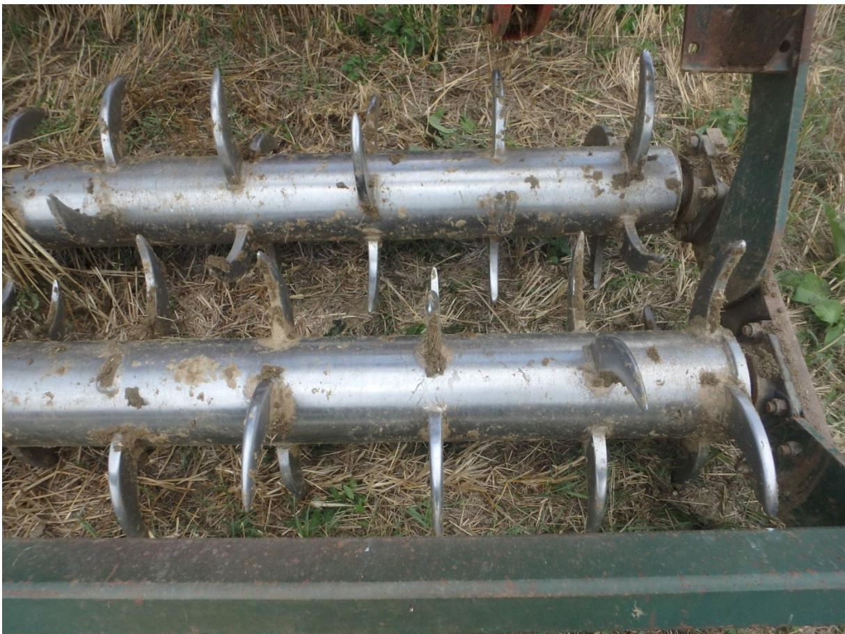
Doppel-Stachel-Walze zur Zerkleinerung, aber wenig Rückverdichtung

Bei Tiefenlockerern sollte grundsätzlich so wenig wie möglich tote Erde und grobe Brocken aus tieferen Bodenschichten an die Oberfläche gebracht, sondern nur schichtenerhaltend Risse in kompakten Bodenblöcken erzeugt werden. Falls eine intensive Zerkleinerung nach Tiefenlockerern notwendig ist, sollte der Anstellwinkel, die Scharbreite und der Strichabstand der Zinken überprüft werden.