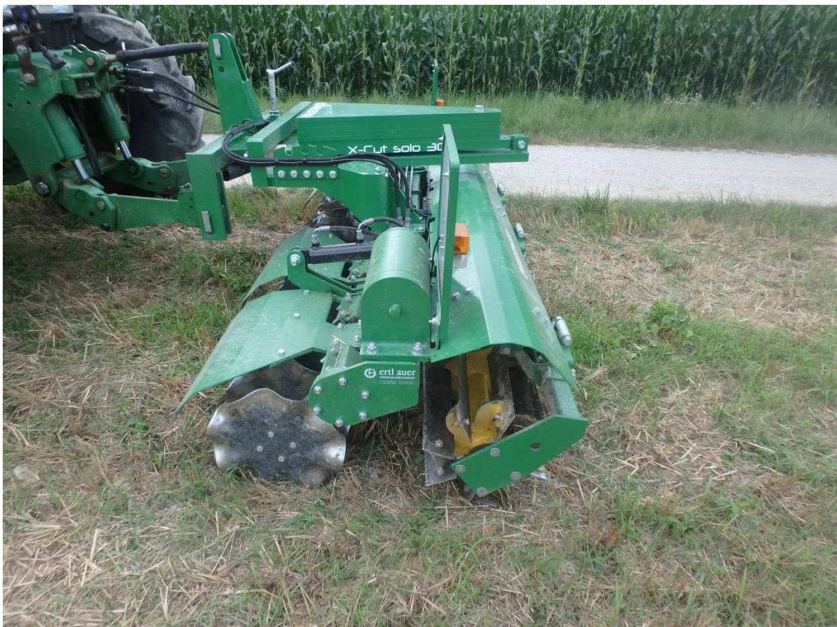
Front-Messerwalze mit Scheibenegge

Der Einsatz von aktiven Frontgewichten ist daher jedenfalls sinnvoller als jener von passiven Frontgewichten (z.B. Betonblöcken).